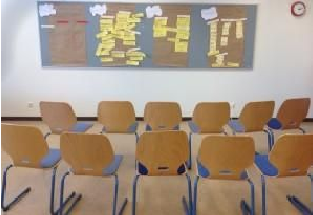
Mynd 3. ÞHG.

Eins og sést kannski á klukkunni á veggnum þá héldu tímamörkin nokkuð vel en þegar myndin er tekin þá er fundi lokið og kennarar horfnir til annarra starfa. Allt gekk vel, eiginlega vonum fram og við fengum fram ágætis (jafnvel óvæntar) upplýsingar um stöðu málefnis í stofnuninni sem nauðsynlega þurfti að tæpa á. Það sem mér fannst þó standa upp úr var auðvitað hversu sjónrænt og lýðræðislegt skipulag miðlunaraðferðarinnar er. Enginn einn yfirgnæfði fundinn með sínum eina rétta sannleika heldur tóku allir þátt og allir komu skoðunum sínum á framfæri. Meira að segja voru þarna svör eða ábendingar sem gat verið erfitt að koma með fram undir nafni.